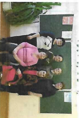
ПМО учителей филологии