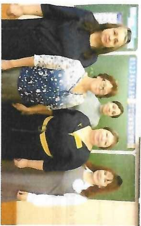
ПМО учителей начальных классов